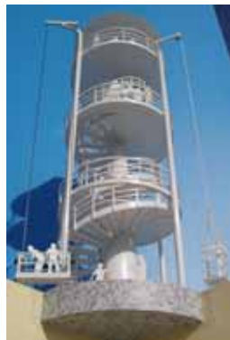
見晴し展望避難所施設