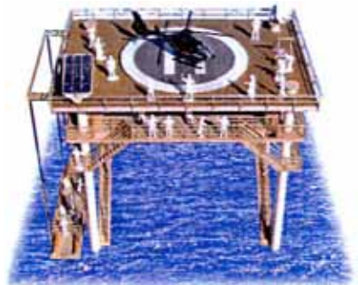
ヤグラ式10～15メートル高台避難施設