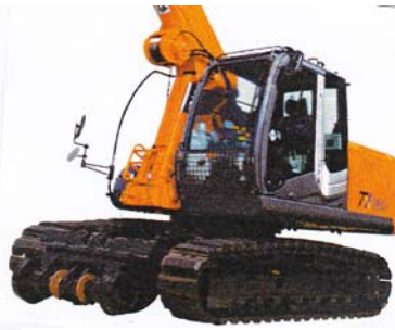
クローラークレーン 10t