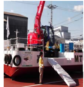
重機ダンパー 自力の乗降足場付