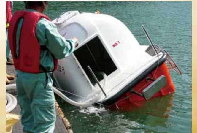
浸水実験確認 二重底内に発泡材取付による室内に浸水しても沈没しない Flood Test/ Do not sink even if the boat was flooded.