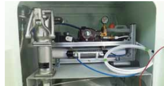
海水淡水化浄水装置 Seawater / freshwater water purification equipment