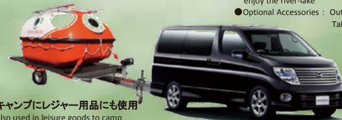
キャンピングレジャー用品にも使用 Also used in leisure goods to camp