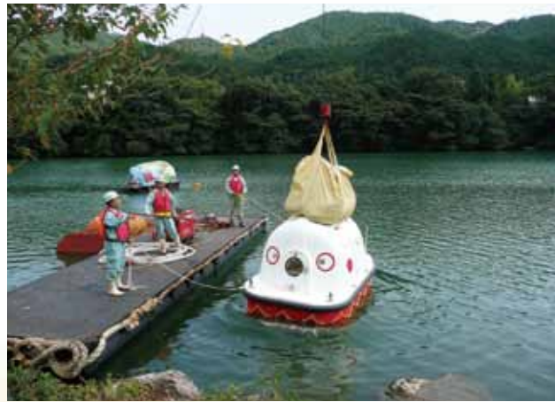
衝撃実験確認 本体の5m上方より200Kg土嚢の落下に耐える Impact Test / It withstands 200kg body impact from a drop height of 2m.