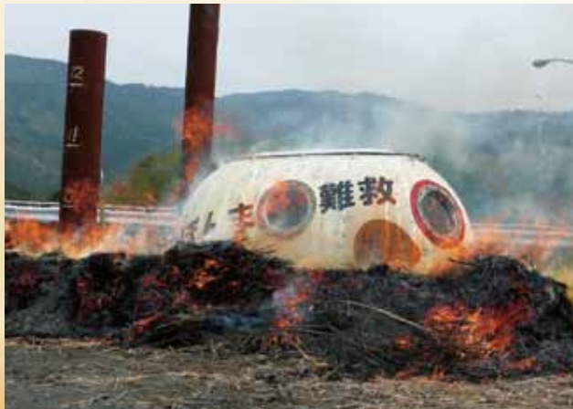
散水実験確認 手押しポンプで火災時散水 Watering Test /Sprinklers by the hand pump are effective in fighting fires.