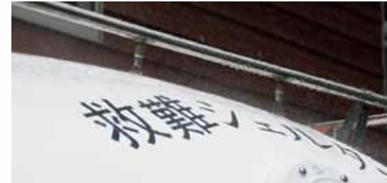
火災時手押し散水ポンプ Extinguishing pump