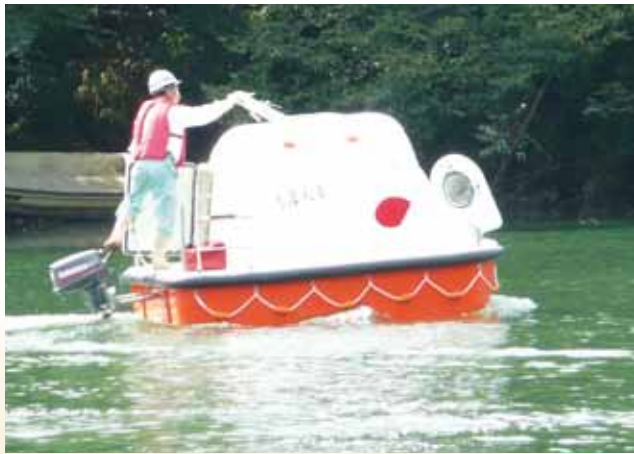
走行実験確認 オール、船外機による航行 (船舶免許不要：船外機2馬力以下) Navigate Test/ It is possible to navigate by the oar or outboard motor.

Joint development of safety confirmation. Conduct FRP materials strength test by Kochi University of Technology. And the test results are reflected in the product .