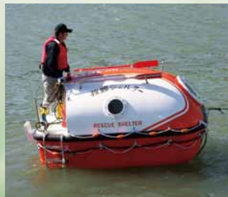
自航手漕ぎオール Oar mounting