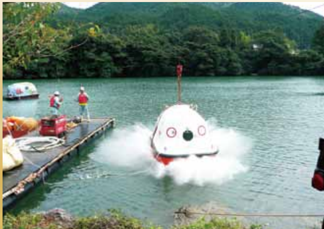
落下実験確認 水面4m上からの落下に耐える Drop Test/ It withstands dropping from a height of 4m above the water.