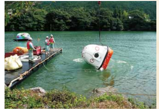
転倒・起上り実験確認 底部重量取付、転倒しても自然に起上る Self-rising Test/ It is capable of self-rising from a fallen state.