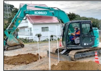
車両系建設機械（整地等）