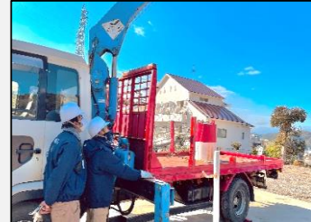
小型移動式クレーン